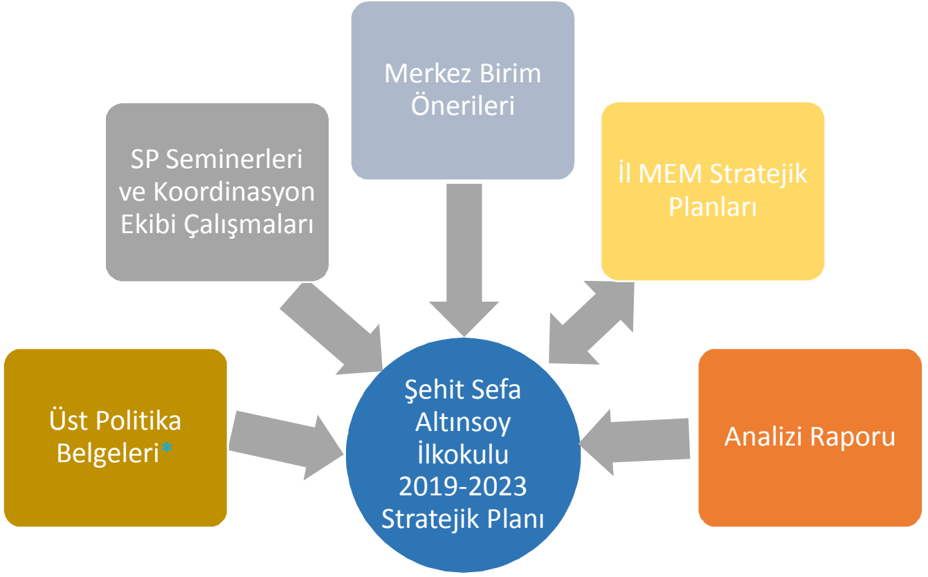
Şekil 2: Stratejik Plan Hazırlık Çalışmaları